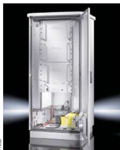
RiCell Flex macht die Brennstoffzellentechnik auch wirtschaftlich attraktiv.

Herborn. Das neue Brennstoffzellensystem RiCell Flex von Rittal wurde aus 80 Einreichungen für den renommierten Hermes Award 2010 nominiert.