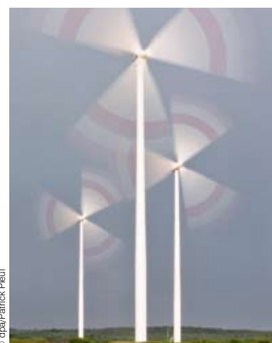
Am 21. und 22. April wird Warschau zum Zentrum der Windenergie.

Wien/Warschau. Am 21./22. April organisiert das Enterprise Europe Network der Wirtschaftsagentur Wien ein Matchmaking für Unternehmen aus dem Bereich der Windenergie. Die Veranstaltung findet in Warschau parallel zur Europäischen Wind Energie Konferenz & Ausstellung (EWEC) statt, zu der sich mehr als 6.000 Keyplayer der Windenergie treffen.